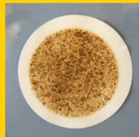
Mikrobewachstum mit herkömmlichem Diesel!