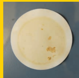
Beispielbilder zur Illustration, basierend auf Diesel mit 7 % FAME.